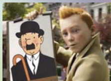
Les policiers Dupont et Dupond ?