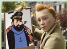
Le capitaine Haddock ?