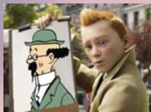
Le professeur Tournesol ?