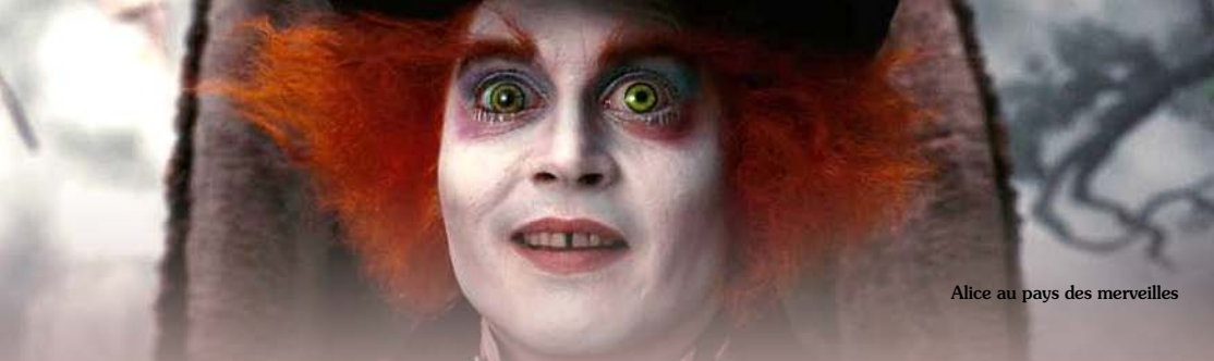
Alice au pays des merveilles